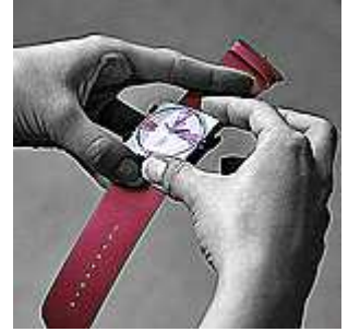
4. Säädä kello oikeaan kohtaan liuttamalla pidikettä rannekeessa

Kun haluat irrottaa kellon rannekkeesta paina yht'aikaa pidikkeen jomman kumman puolen kahta koukkuun alaspäin ja nosta samalla kelloa ylöspäin