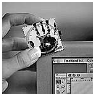
2. Laita kello mihin tahansa sileään pintaan