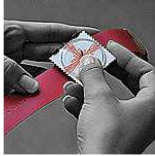
3. Paina kevyesti kellon oikeasta reunasta kunnes kello naksahtaa paikalleen