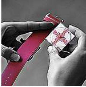
2. Aseta S.T.A.M.P.S kello vasen reuna edellä pidikkeen kahteen koukkuun