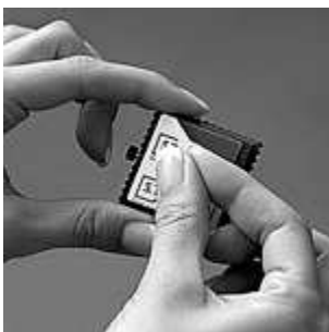
1. Poista tarran suojapaperi säilytä suojapaperi

S.T.A.M.P.S. kelloissa on 3MScotch-tarrapinta, jonka ansiosta kiinnität kellon paikkaan kuin paikkaan aina uudestaan ja uudestaan.