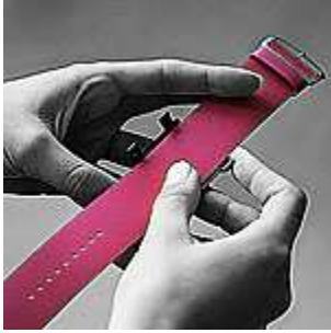
1. Aseta ranneke pidikkeen päälle