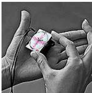
2. Aseta kello vasen reuna edellä pidikkeen kahteen koukkuun